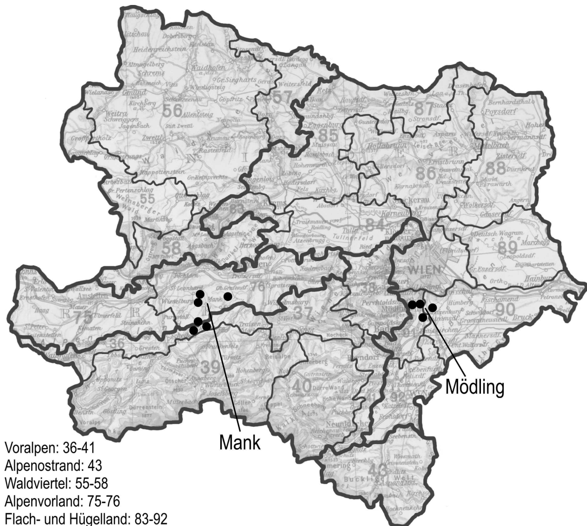
Abb. 1: Lage der Untersuchungsregionen und -gemeinden innerhalb der landwirtschaftlichen (Klein-)Produktionsgebiete Niederösterreichs 1966

des 20. Jahrhunderts nicht von der Stadt, sondern vom Land aus. Dabei suchen wir das Land in seiner zugleich reaktiven und aktiven Rolle – als Netzwerk denk- und handlungsmächtiger Akteure innerhalb begrenzter Manövierräume – zu erfassen. Die Gegenstände, an denen wir die Doppelrolle des Landes in seiner Beziehung zur Stadt auszuloten suchen, bilden der Agrarmediendiskurs niederösterreichischer Bauernzeitschriften und die bäuerliche Wirtschaftspraxis in zehn Gemeinden aus zwei Regionen Niederösterreichs – einer stadtnahen und einer stadtfernen – zwischen den 1940er und den 1980er Jahren (Abb. 1). 6