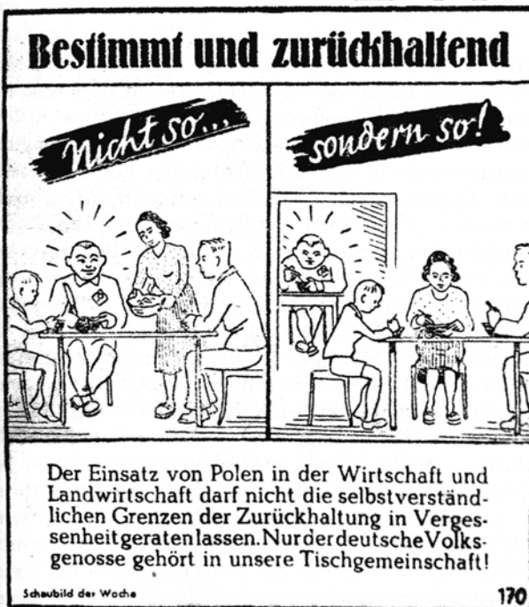
Abbildung 1: Schaubild im Amstettner Anzeiger 1943

Ein 1943 im Amstettner Anzeiger erschienenes Schaubild fordert die „Volksgenossen“ auf, gegenüber den „fremdvölkischen“ Arbeitskräften die Grenzen zu wahren. Sie seien zwar in der (Land-)Wirtschaft eingesetzt, gehörten jedoch nicht der Tischgemeinschaft – dem gemeinsamen Mahl der Haushalts- und Betriebsangehörigen – an (Abbildung 1). Damit ist der konstitutive Widerspruch des deutschen „Reichseinsatzes“ während des Zweiten Weltkriegs angesprochen: der ökonomisch motivierte Ein- und zugleich rassistisch motivierte Ausschluss der Zwangsarbeiter/-innen. 1 Das wiederkehrende Erscheinen derartiger Grenzmarkierungen in den „gleichgeschalteten“ Medien des Dritten Reiches legt nahe, dass die alltägliche Praxis mitunter von der nationalsozialistischen Norm abwich. Kurz, vielfach war es „nicht so“, wie es sein sollte, „sondern so“, wie es nicht sein sollte. Die scheinbar unpolitische Alltagsmahlzeit konnte so zu einem politischen Akt werden. 2 Daher lohnt es, das Kräftefeld der ländlichen Zwangsarbeit aus der Perspektive des Ernährungsalltags zu vermessen.